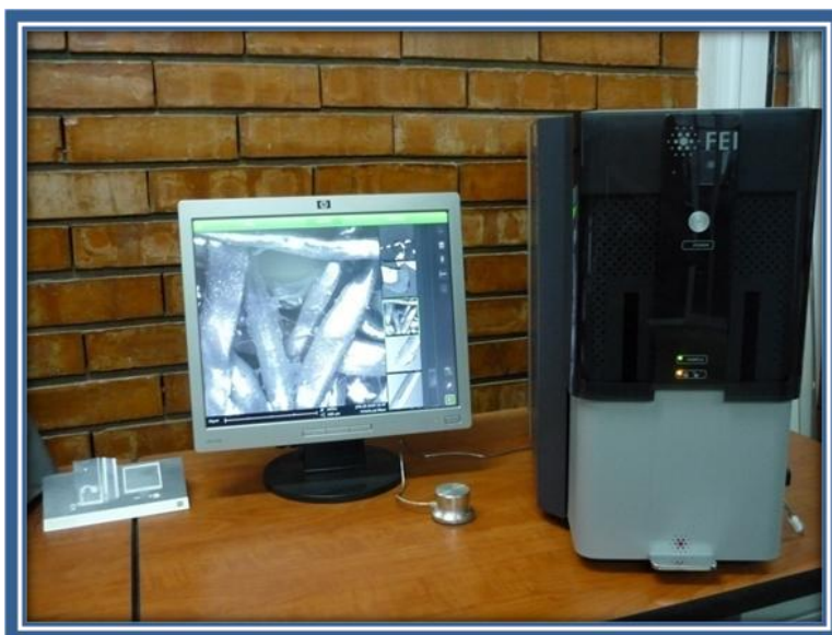
Microscopia Electronico de Barrido - SEM